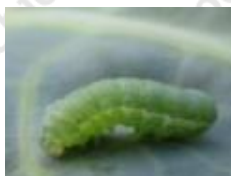
シロイチモジヨトウ