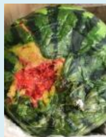
写真は果実軟腐病

症状：▶ 果肉の軟化腐敗 ▶ 悪臭 伝染：不明 畑土に接触した果実面からの感染ではないかといわれている