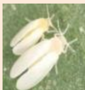
タバココナジラミ

対策 ▶発病株は圃場外へ適切に処分する ▶余分な下葉はかきとる ▶適切な肥培管理を行う